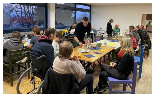
Abendessen in der Unterkunft