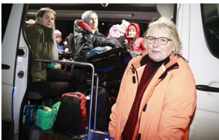
Kurz nach der Grenze zwischen Polen und der Ukraine

Ehrenamtliche versorgen die Geflüchteten auch medizinisch und rechnen mit einer monatelangen Betreuung.